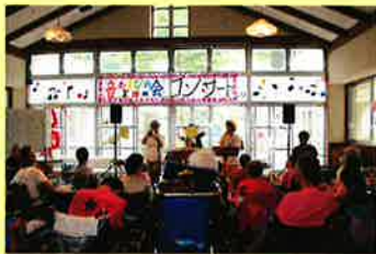
音あそびの会の皆様